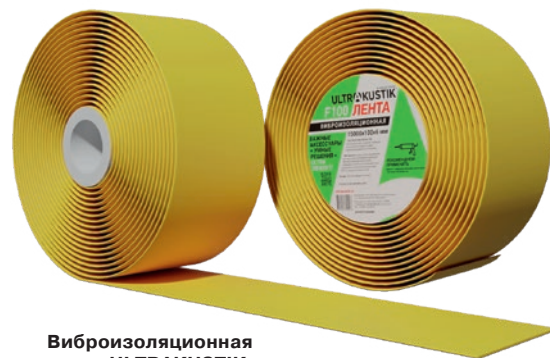
Виброизоляционная лента ULTRAKUSTIK

Концепция звукоизоляции помещений с помощью линейки аксессуаров для акустического тюнинга УЛЬТРАКУСТИК® является единственным на сегодняшний день решением, доступным в любой точке РФ и по доступной цене!