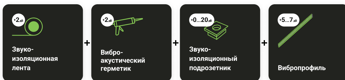
Рис. Эффективность звукоизоляции элементов линейки УЛЬТРАКУСТИК®

В Акустик Групп® была разработана концепция «акустического тюнинга» для повышения звукоизоляции гипсокартонных поверхностей под названием УЛЬТРАКУСТИК®. В практическом смысле это линейка специальных аксессуаров, позволяющих повысить звукоизоляцию стандартных гипсокартонных конструкций.